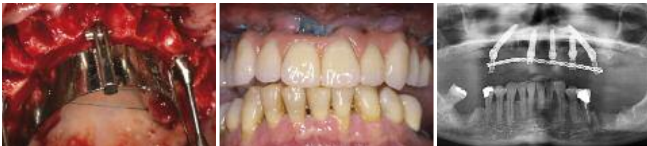
Abb. 4: Implantation und Ausrichtung der Abutments mithilfe der Führungsschablone. – Abb. 5: Fertige Sofortversorgung im Munde des Patienten. – Abb. 6: Röntgenkontrolle. Bei Ungenauigkeiten in Hinblick auf die Passung der Abutments (hier Regio 15) muss die temporäre Hülse aus der Versorgung gelöst und im Munde des Patienten wieder neu fixiert werden. In diesem Fall wurde aufgrund der geringen primären Stabilität des Implantates bei 21 ein weiteres Implantat Regio 23 eingesetzt.

Lachlinie als Ausschlusskriterium. Die Nachuntersuchung erfolgte in einem Zeitraum zwischen einem und 20 Monaten nach der Insertion und Belastung der Implantate. Die Behandlung erfolgte nach folgendem Protokoll: