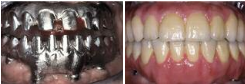
Abb. 7: Einprobe der CAD/CAM-Gerüste am Beispiel einer Totalversorgung im Ober- und Unterkiefer. – Abb. 8: Definitive Versorgung. In diesem Fall wurde im Oberkiefer eine keramische Verblendung und im Unterkiefer eine Kunststoffverblendung durchgeführt.